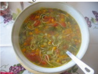
Soupe au pistou