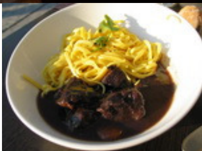
Andouille de Vire