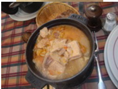
Bergamotes de Nancy